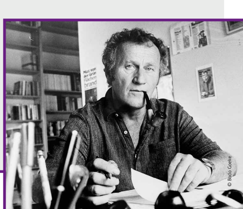
Max von der Grün