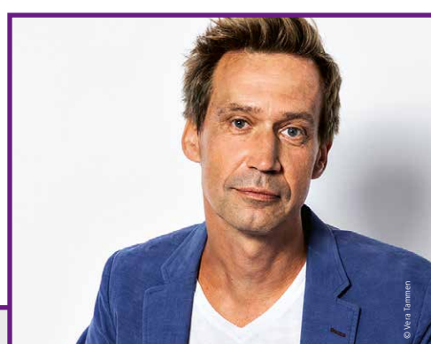
Literaturtage Recklinghausen mit Volker Weidemann

Ort: Recklinghausen · Veranstalter: Stadt Recklinghausen – Fachbereich Kultur, Wissenschaft und Stadtgeschichte · Weitere Infos: www.literaturtage-recklinghausen.de