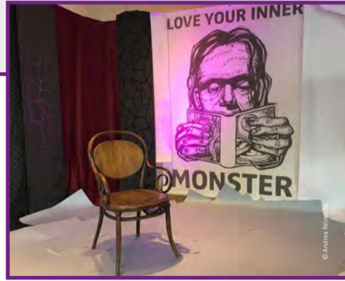
Schwerte liest „Frankenstein“

Ort: Schwerte · Veranstalter: Kulturbüro im KuWeBe Weitere Infos: www.schwerteliest.de