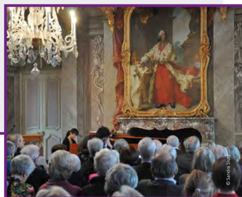
Droste-Matinee im Erbdrostenhof

Ort: Münster · Veranstalter: Annette von Droste-Gesellschaft e. V. Weitere Infos: www.droste-gesellschaft.de